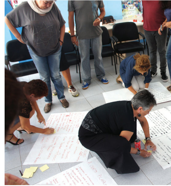
תמונות עתיד לפעולות משנות מציאות - כל צוות הגדיר משימות לטווח הקצר והארוך בתחום העשייה, האחריות והרצון שלו