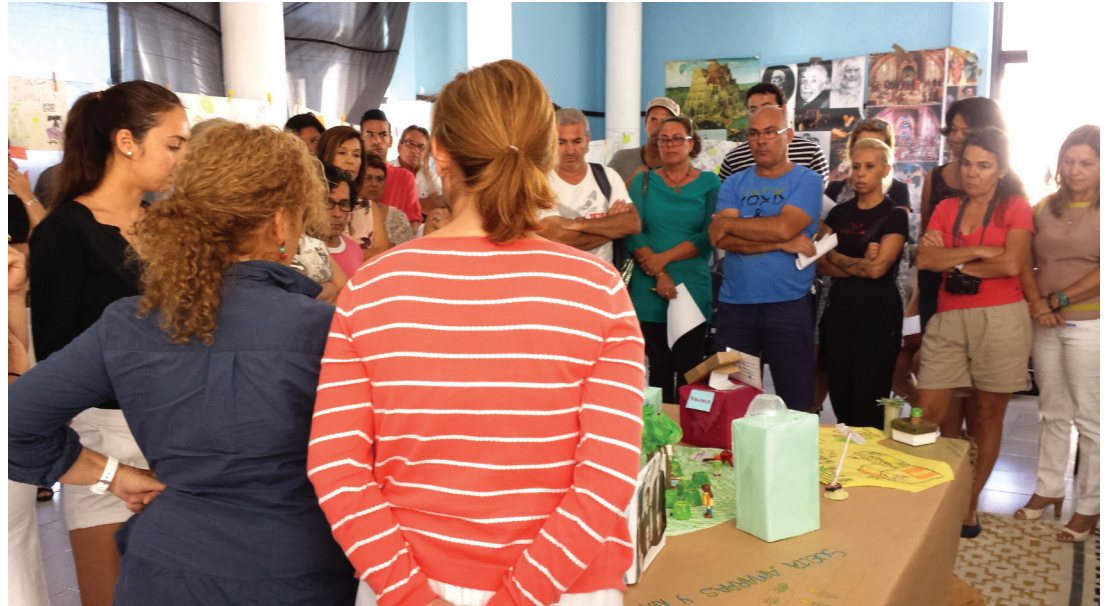
תמונת העתיד המשותפת מוצגת לחברי קהילת האי

מעשי ביותר, של הקבוצה. המשתתפים התחלקו לקבוצות תפקיד: שולחן להורים, שולחן תלמידים, שולחן מורים, שולחן רשות מקומית ושולחן של מרכז הלימוד המקומי.